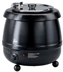
Art. H9310 schwarz/noir