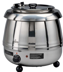
Art. H9311 chrom/chrome